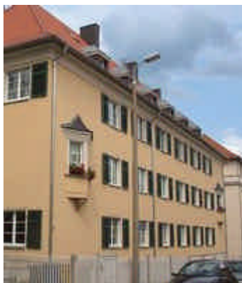
Mietwohnungen der WG 1918 in der Friedrich-Schelling-Straße