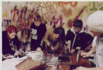
Jugendliche im Projekt Metallverarbeitung