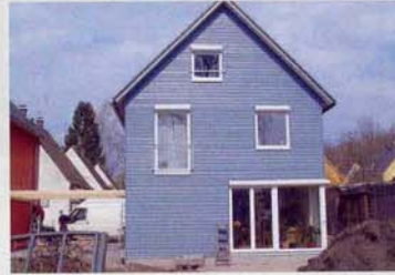
Neubau in der Dorniersiedlung, 2004