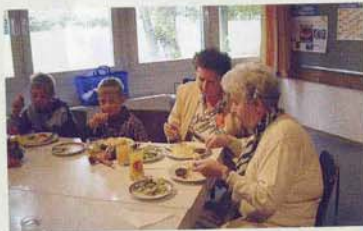
Miteinander essen in Lindau-Zech