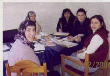
Türkischunterricht von Bewohnern für Bewohner