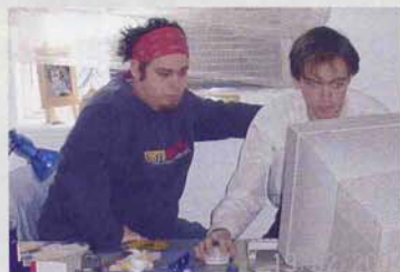
Jugendliche designen die Homepage für den Stadtteil