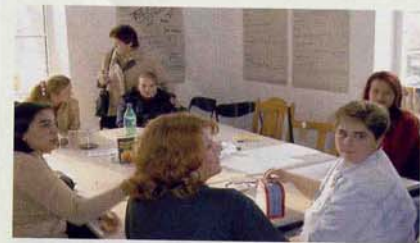
Obern: Internationaler Frauentreff

Frauen der Mutter-Kind-Gruppe haben „Werbung“ für den Treff gemacht, andere Frauen angesprochen und auch ausländische Frauen für Idee eines Treffpunktes im Gebiet begeistert. So kamen relativ früh ausländische Frauen in den Treff. Die haben wieder andere gefragt, die teilweise gar nicht Deutsch konnten usw. Wichtig war auch, dass es keine Räume der Kirche waren. Unsere Vorstellung war, dass wir einen Treff schaffen, in den auch die Oma von nebenan