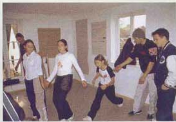
Jugendliche geben Breakdance-Unterricht