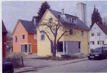
Neubau in der Dorniersiedlung, 2004