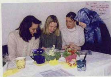
Eine Gruppe Zecher Frauen in einem der zahlreichen Kurse im Treff