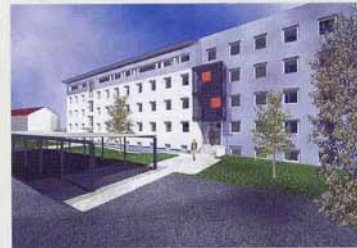
Planung: Modernisierung Ledigenheim, GWG, 2004