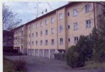
„Ledigenheim“ vor der Modernisierung, 2004