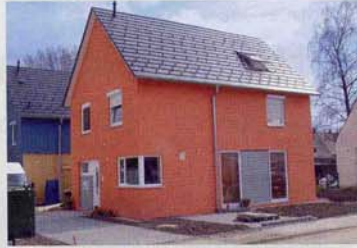
Neubau in der Dorniersiedlung, 2004