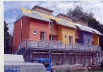
Junges Wohnen, Wohnturm in der Realisierung, 2004