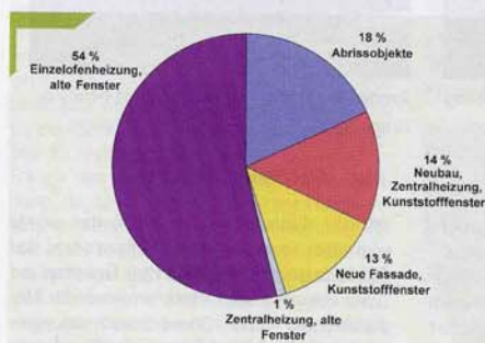
Abb. 1: Baulicher Zustand der Wohnungen in Zech

Durch eine sehr kritische Belegung wurde das sog. „Ledigenheim“ in den letzten Jahren immer mehr zum sozialen Brennpunkt im Stadtteil. Das durch die Firma Kunert verwaltete Ledigenheim verfügt über rd. 80 lediglich 8,5 qm große Einzimmerwohnungen (ohne integrierte Küche und Badezimmer). Ursprünglich wohnten in dem Haus Angestellte der Firma Kunert, im Laufe der Jahre änderten sich die Wohnansprüche der Mitarbeiter und die Wohnungen wurden vor allem von ausländischen Männern bezogen, die auf dem freien Wohnungsmarkt Probleme hatten, eine Wohnung zu finden. In der Regel nutzten die Bewohner das Zimmer als „Übergangslösung“, die Fluktuation war dementsprechend hoch. Die „Übergangsbewohner“ haben keine Rücksicht auf die Alteingesess-