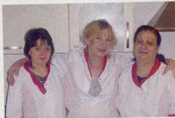
Vorbereitungen für den Mittagstisch in Zech