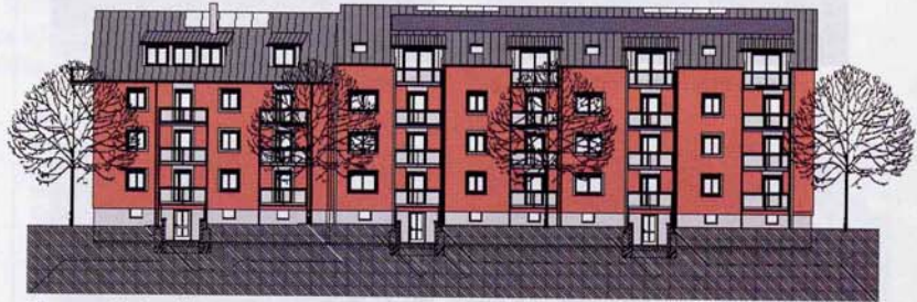
Planung: Modernisierung Immanuel-Kant-Straße, GWG, 2004

Für die GWG sind diese umfassenden Bestandsveränderungen eine „Mammutaufgabe“. Von besondere Bedeutung ist daher die gute Zusammenarbeit aller Beteiligten (GWG, Verwaltung, Bürgerbeteiligung), ein reibungsloses Modernisierungsmanagement seitens der GWG sowie Geduld und Verständnis der Mieter, die maßgeblich von den Modernisierungen betroffen sind. Für die GWG war und ist bei allen Überlegungen der Faktor Zeit sehr wichtig. Um den Abwärtstrend in Lindau-Zech zu stoppen und den Stadtteil insgesamt zu stabilisieren, ist eine zügige Umsetzung der geplanten