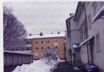
Junges Wohnen, geplante Nachverdichtung über Garagen, 2003