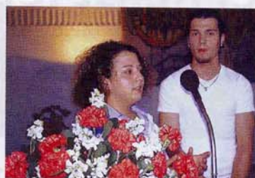
Starterkonferenz, Mai 2001: Jugendliche präsentieren ihre Anliegen

den, dass aus Sicht der Bewohner vier Themen als besondere Handlungsschwerpunkte gesehen wurden: Neubau für junge Familien, Wohnen im Alter, Kinder-/Jugendliche, Schule/Integration.