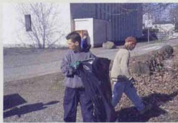
Jugendliche beim Aufräumen im Quartier