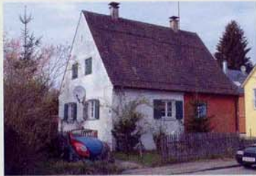
Bestandsgebäude in der Dorniersiedlung, 2004