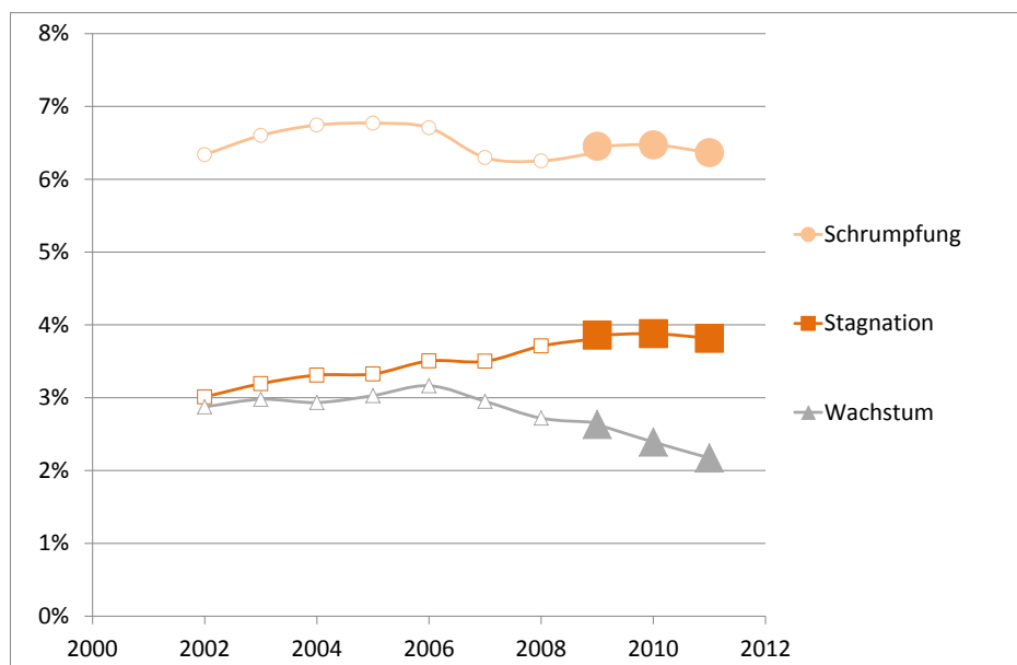
Abbildung 2: Marktaktiver Leerstand in Wachstums- und Schrumpfungsregionen 2002-11

Quelle: CBRE-empirica-Leerstandsindex, empirica-Leerstandsindex (2002-08)